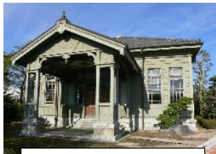
学校の敷地内に残る歴史ある文化財