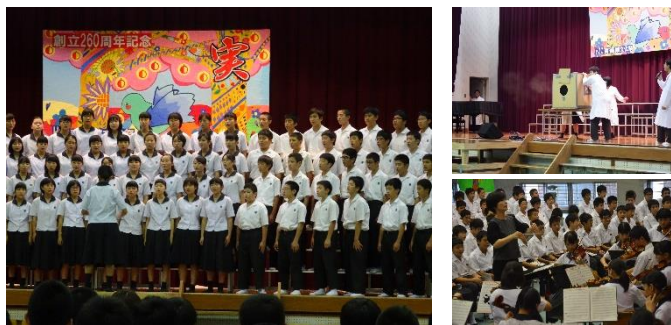
<中高合同の文化祭>

行事（体育大会・文化祭）や部活動をはじめ、様々な活動に中・高一緒に取り組んでいます。