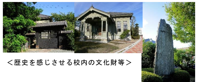
<歴史を感じさせる校内の文化財等>