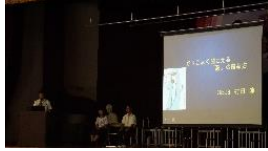
<育徳プラン発表会>