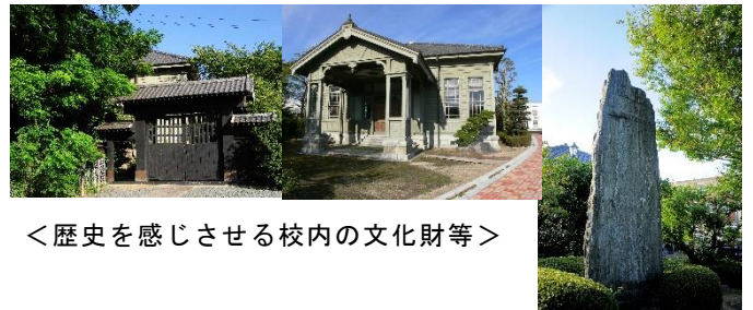
<歴史を感じさせる校内の文化財等>