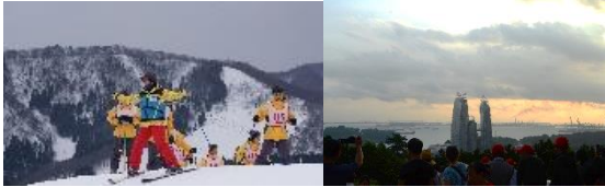
<中学：兵庫県、高校：シンガポール>