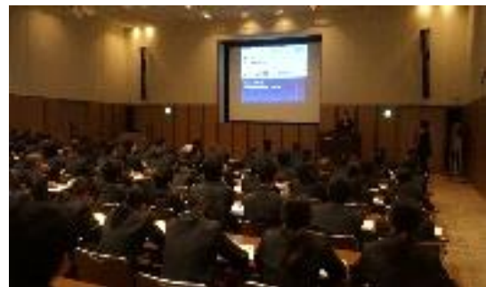
<企業等視察研修の講義>