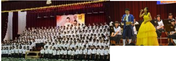
<中高合同の文化祭>

行事(茶摘み・体育大会・文化祭)や部活動をはじめ、様々な活動に中・高一緒に取り組んでいます。